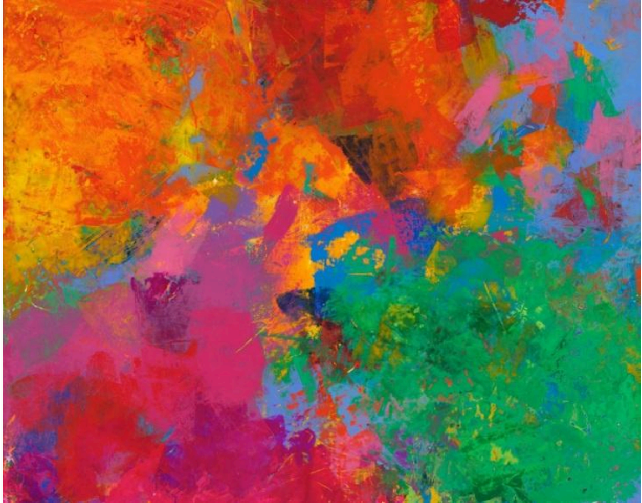
Let's Make It Beautiful © Nicholas Kontaxis

«Το “Catch Me” είναι το όνειρο του Νικόλα να μοιραστεί την τέχνη του με την Ελλάδα, τη χώρα των προγόνων του. Είναι η δική μας πρόσκληση στο κοινό να πιαστούμε χέρι χέρι και να δούμε πώς η δημιουργικότητα μπορεί να γίνει καταφύγιο, ελπίδα και τρόπος ζωής. Ο Νικόλας δεν μπορεί να μιλήσει με λόγια, αλλά μέσα από τα έργα του λέει όσα οι λέξεις συχνά αδυνατούν να εκφράσουν», δήλωσε χαρακτηριστικά ενθουμούμενη τον αγώνα που κάνει μαζί με το γιο της όλα αυτά τα χρόνια. Με την κατάσταση της υγείας του να χειροτερεύει σταδιακά και τις επιληπτικές κρίσεις του να αποτελούν υπενθύμιση για