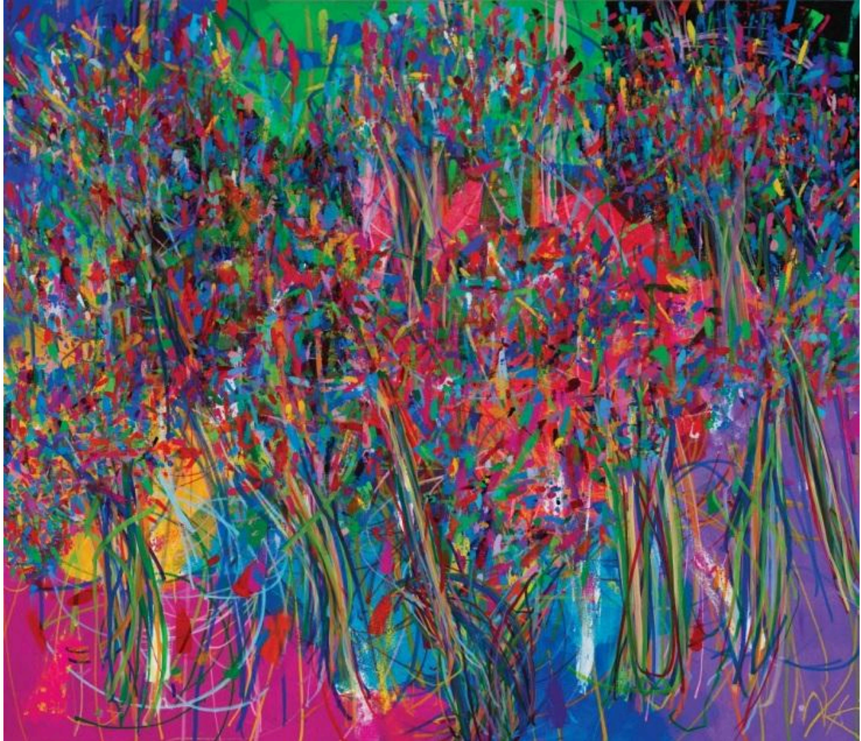
I am Lonely © Nicholas Kontaxis

Κλείνοντας τη συζήτησή μας με την κα Kontaxis, αναρωτιόμαστε το προφανές. Πού βρίσκει τη δύναμη ώστε να μη λυγίσει μπροστά στις δυσκολίες που αντιμετωπίζει ο γιος της όλα αυτά τα χρόνια.