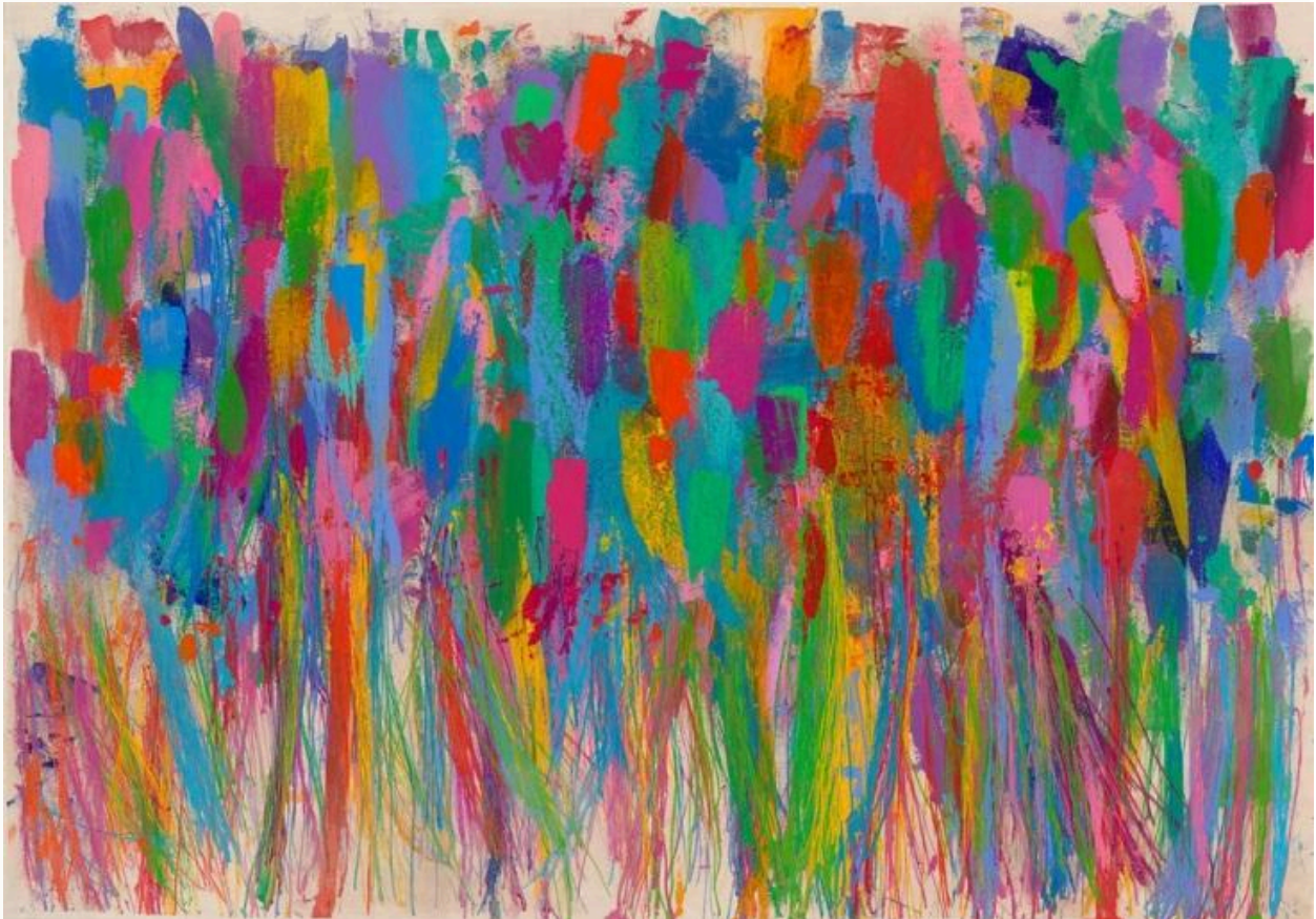
We Are Young © Nicholas Kontaxis

υπάρχει «βρομιά» η οποία αντί να τον αποτρέψει, ενσωματώθηκε στη διαδρομή του και στον τρόπο δουλειάς του. Ακόμα και στις χειρότερες των ημερών, όταν δεν μπορούσε καν να σηκωθεί, ήθελε να προσεγγίσει το έργο του και να νιώθει έμπνευση. Κάπως έτσι ήρθε και η χρήση όλων αυτών των υλικών, πολλά από τα οποία προσομοιάζουν με τη βρομιά», αναφέρει χαρακτηριστικά η κα Kontaxis, ώστε να συνεχίσει μιλώντας για το εξαιρετικά δύσκολο βίωμά της, το οποίο και αποτέλεσε την έμπνευση για το όνομα της έκθεσης.