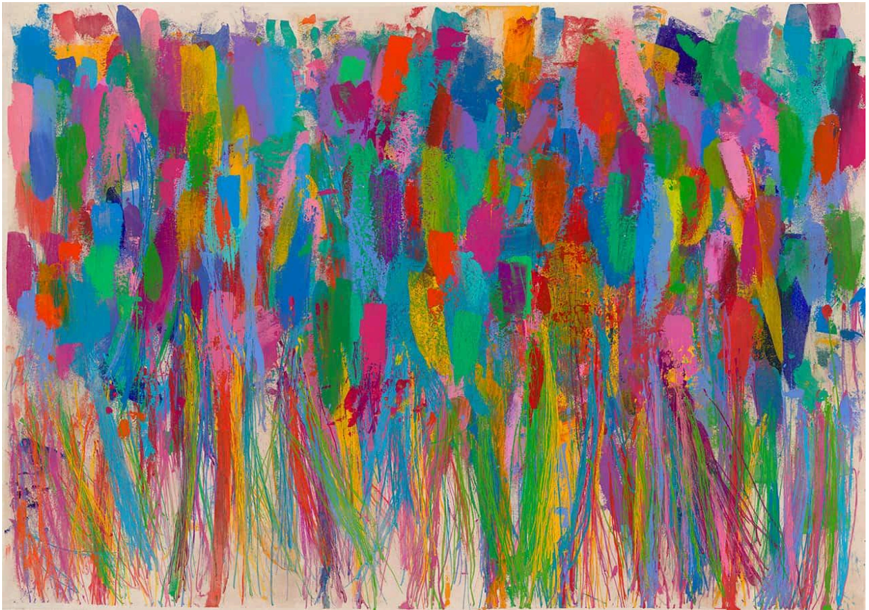
We Are Young

Η τέχνη ήταν ανέκαθεν ένα πανίσχυρο μέσο υπέρβασης δυσκολιών, είτε πρόκειται για σωματικές, ψυχικές, κοινωνικές ή πολιτισμικές προκλήσεις. Από ζωγράφους που βρήκαν παρηγοριά στους καμβάδες τους όπως ο Βίνσεντ βαν Γκογκ, ο διάσημος εμπνευστής της Έναστρης Νύχτας μέχρι συγγραφείς όπως ο Φιόντορ Ντοστογιέφσκι αλλά και ο Φλωμπέρ, αγαπημένος συγγραφέας της Μαντάμ Μποβαρί που έπασχε από επιληψία από την εφηβική του ηλικία σύμφωνα με προσωπικές του επιστολές που μετέτρεψαν το τραύμα σε λογοτεχνία, η δημιουργία λειτουργεί ως ένας τρόπος επεξεργασίας, κατανόησης αλλά κυρίως μεταμόρφωσης του πόνου, μια διαδρομή υπέρβασης των δυσκολιών.