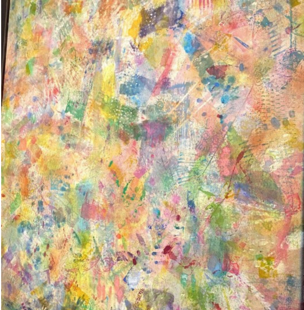
Λεπτομέρεια από το έργο "Windows Down and Cruise", ακουαρέλα, ακρυλικό και gouache σε αστάρωτο καμβά

Η δουλειά του Νικόλα Κονταξή , αν και έχει αναγνωριστεί παγκοσμίως, με ατομικές εκθέσεις , βραβεία και τη συμπερίληψή του στη λίστα των Forbes "30 under 30", έρχεται για πρώτη φορά στην Ελλάδα. Όπως εξέφρασαν και ο επιμέλητης Arthur Lewis και η μητέρα του καλλιτέχνη και εκπρόσωπος